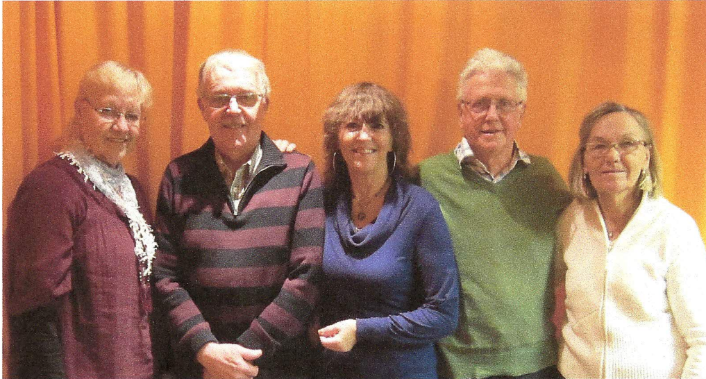
Styrelsen från 16/6-2011