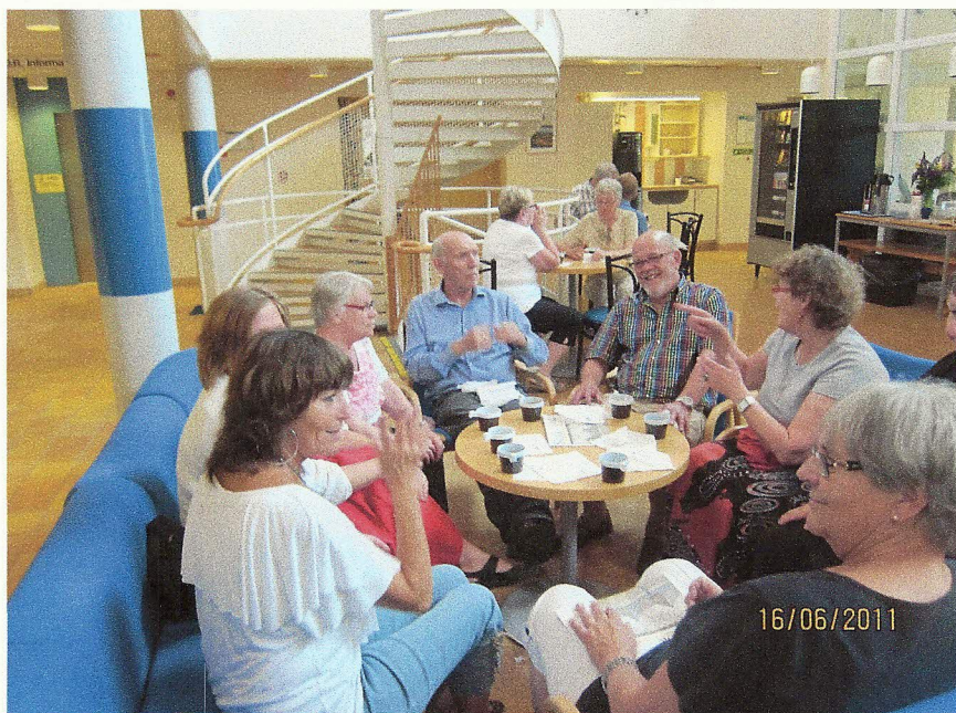
Kaffepaus vid föbundsstämman 16/6-2011 på Västanviks fhsk